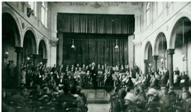
Abb. 1.: Bürgeraal ca. 1925.

Nach einer schriftlich festgehaltenen Aussage von C. Hans von Gimborn, wurde die Feier um ein Jahr verschoben. Ursprünglich hätte diese 1933 stattfinden sollen, 700 Jahre nach der Stadterhebung im Jahr 1233. Aufgrund der „Machtergreifung“ wurde das geplante Datum jedoch nicht eingehalten und zeitgleich ein neuer Bürgermeister eingesetzt. 1 Im Februar 1934 wurde schließlich bekannt gegeben, dass der Festausschuss mit den Vorbereitungen der Feier begonnen hatte. Diese sollte vom 30.05. bis zum 03.06.1934 stattfinden. Einzelheiten waren noch nicht festgelegt. Heimatabende und eine Jugendkundgebung wurden als Programmpunkte jedoch bereits erwähnt. 2