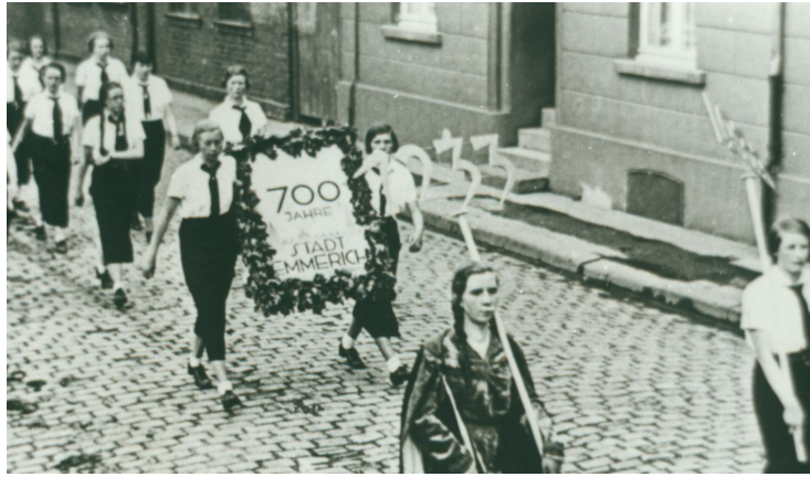
Abb. 6.: Historischer Festzug.