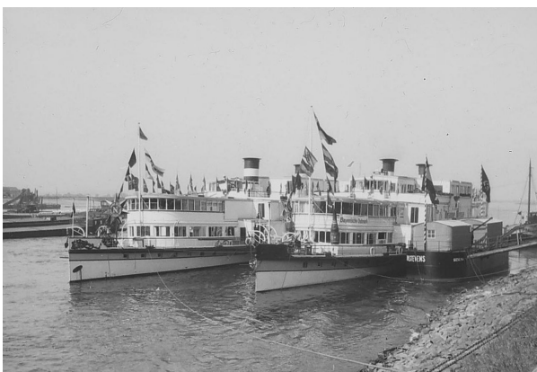
Abb. 2.: Schwimmende Braune Messe, Rheinpromenade.