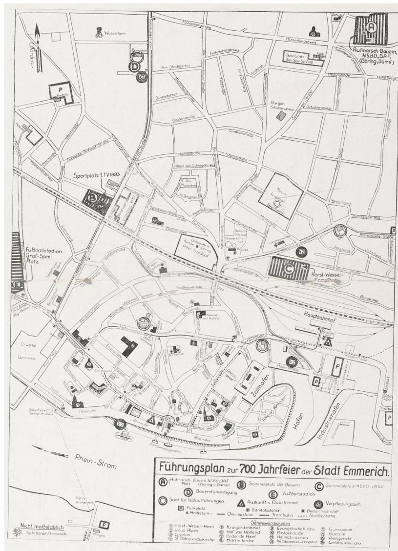
Abb. 4.: Führungsplan zur 700- Jahrfeier.