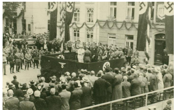
Abb. 10.: Hermann Göring spricht auf dem Geistmarkt.

„Es wurde nicht vergessen nachzuzählen, wie oft der ‚Dicke‘ seine Uniform wechselte. Wenn ich nicht irre, war es vier oder fünfmal. Ich habe ihn jedenfalls in brauner Uniform ankommen sehen, als ich als ‚Pimpf‘ auf Befehl in der Nähe der Schleip’schen Papierfabrik zur Straßendekoration stundenlang warten mußte, bis der Autokonvoi in enttäuschend rascher Fahrt an uns vorbeieilte. Görings weitere Uniformen waren eine weiße und dann natürlich die fliegerblaue Uniform des späteren Luftmarschalls. Göring hatte bekanntlich, wie manche Emmericher auch,