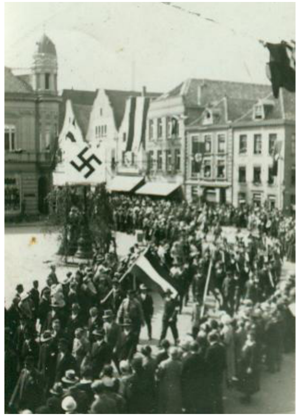
Abb. 8.: Historischer Festzug entlang des Altmarkts.

Am Vormittag des 02.06.1934 standen vermutlich zahlreiche Schaulustige an der Rheinpromenade. Dort wurde eine „Geschwaderfahrt“ von fünfzig rheinischen Segeljachten, mit Besuch des Emmericher Hafens, durchgeführt. 15 Auch Admiral von Trotha war anwesend. Die Fahrt fand im Zuge der „Rhein-Woche“, einer Veranstaltung der Wassersportler, statt. Sie sollte von Rees bis nach Emmerich führen. 16 Ab Mittag war die Stadt von einem historischen Umzug geprägt, der vom Hüttenweg aus durch „das alte Stadtbild“ führte. 17