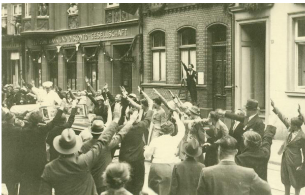
Abb. 9.: Hermann Göring besucht Emmerich.

Das Hauptereignis stellte der anschließende Besuch Hermann Görings dar. Ganz Emmerich soll auf den Beinen gewesen und für Görings Wagen und seine Begleitung kaum ein Durchkommen möglich gewesen sein. 27 Auf dem Marktplatz bzw. dem Geistmarkt fand die Begrüßung durch den Bürgermeister statt. Anschließend erfolgte die Übergabe des Ehrenbürgerbriefes. Göring dankte Emmerich für die Ehrung durch seine Vaterstadt, in der seine Familie seit Jahrhunderten gelebt hätte. Emmerich sei die letzte Stadt an der Grenze und damit ein Vorposten Deutscher Kultur. 28 Anschließend besuchte Göring das Grab seiner Eltern und „Haus Hassent“, in welchem sein Großvater früher gelebt hatte. 29 Den Emmerichern sind besonders die „Kostümwechsel“ des ehemaligen Reichsmarschalls im Gedächtnis geblieben.