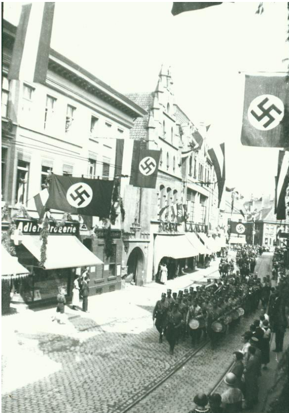
Abb. 7.: Historischer Festzug entlang der Steinstraße.

Das Festprogramm begann am Folgetag mit einer Veranstaltung des Emmericher Marinevereins, einer Gedenkstunde mit Kranzniederlegung für die bei Skagerrak umgekommenen Kameraden am Kriegerdenkmal. 10 Um 14 Uhr wurde die „Schwimmende Braune Messe“ offiziell eröffnet. 11 Ab 16 Uhr konnte ein Niederrheinisches Volksfest auf dem Gelände des Emmericher Margarinefabrikanten Dr. Max Boemer besucht werden. Stadtführungen mit anschließendem Besuch des ehemaligen Heimatmuseums, ergänzten das Angebot. 12 Wie bereits am Tage zuvor wurde auch an diesem Abend wieder eine Korsofahrt der Wassersportvereine veranstaltet. 13 Kulturell Interessierte konnten ebenfalls einen Deutschen Abend unter Mitwirkung des Duisburger Stadttheaters besuchen. 14