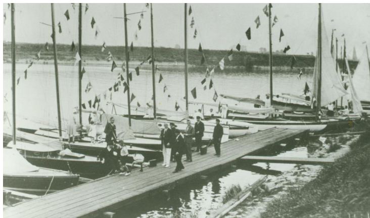
Abb. 5.: Yachtclub im staatlichen Sicherheitshafen von Emmerich, ca. 1930.

Friedensträger des „neuen Deutschlands“ zu seinem ausländischen Nachbarn. Zahlreiche Firmen und Offizielle überbrachten der Stadt ihre Glückwünsche. Neben dem Kreis Rees und seinen Gemeinden, vertreten durch Landrat Dr. Mülle, dem Rheinischen und Deutschen Städtetag, überbrachten unter anderem auch die Niederrheinische Industrie- und Handelskammer Duisburg-Wesel und der Regierungspräsident, vertreten durch Vizepräsident Dr. Bachmann, ihre Grüße. 4 Ebenso empfing die Stadt zahlreiche Glückwunschtelegramme aus den benachbarten Niederlanden. Umrahmt wurde die Veranstaltung musikalisch von Essener „Opernkräften“. Den Abschluss fand der erste Tag mit einer „Lampionkorsosfahrt“, veranstaltet durch die Wassersportvereine, entlang der feierlich beleuchteten Rheinpromenade. 6