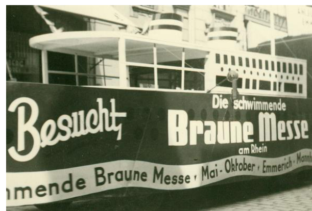
Abb. 3.: Werbewagen der Schwimmenden Braunen Messe.