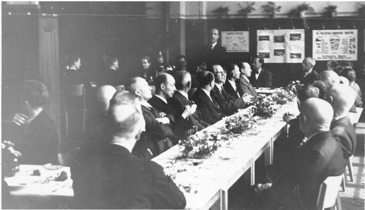
Abb. 3: Das NRW-Kabinett um Ministerpräsident Arnold in Emmerich, 1950.

Oft fuhr Van Aaken drei mal pro Woche nach Düsseldorf, um bei den zuständigen Regierungsstellen um Hilfe zu bitten. 1948 brachte er das Kabinett von Nordrhein-Westfalen unter Ministerpräsident Arnold dazu, die zerstörte Stadt zu besuchen und sich selbst ein Bild von der gravierenden Situation vor Ort zu machen. Dies zeigte durchaus Wirkung und die Stadt erhielt fortan nun mehr Unterstützung. Ebenfalls ist ihm zu verdanken, dass Emmerich eines der sogenannten „Schweizer Dörfer“ zugeteilt bekam, um die Wohnungsnot zu lindern. 9 Er setzte sich für eine rasche Entrümmerung der Stadt ein, engagierte sich für ein möglichst menschenwürdiges Leben der verbliebenen Emmericher Einwohner und förderte den Aufbau der Industrie.